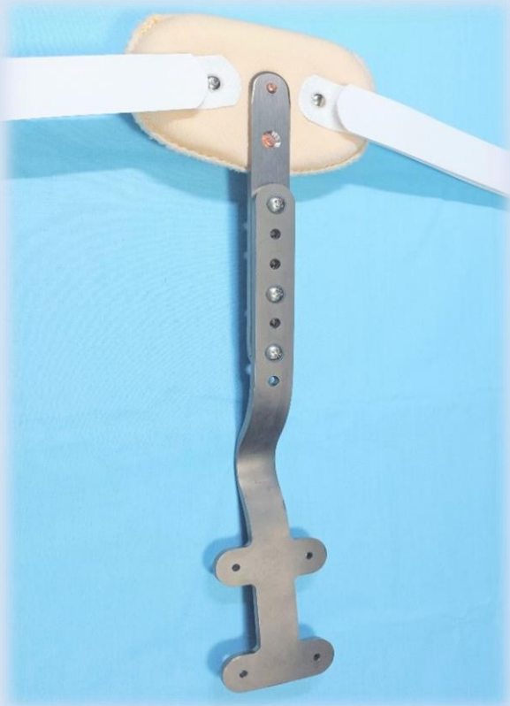
アキシラリーパッド付属品セット